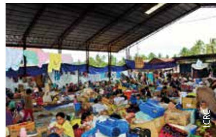
マラウイ郊外にあるサギアランの避難所。約2,500人が避難し、避難所はすし詰め状態

ICRCは他の組織が行けない、または行かない紛争の中心地で活動をしています。いわば紛争のデューフィールドといわれるような場所ですら、武器を携行した警護に守られることもなく、防弾チョッキやヘルメットも着用せず赤十字標章だけをつけて行くのです。そのような場面では、紛争当事者たちと時間をかけて築き上げてきたネットワークや信頼関係によってチームの安全が決まるとも言えます。前任者たちの時代から少し