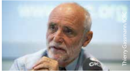
核兵器がもたらす非人道的影響に着目し、使用禁止を訴えたケレンベルガー前総裁

近年加速した核兵器の法的禁止までの流れは、2009年のオバマ米大統領のブラハ演説「核兵器のない世界」や、冒頭のケレンベルガー前総裁の声明などがきっかけに高まった「人道的アプローチ」が基盤になっている、とも報じられています。1