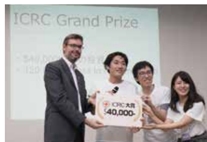
3人の日本人技術者で構成された大賞受賞チーム