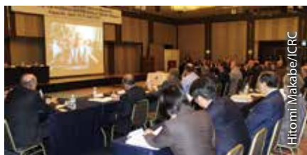
今年4月の国際赤十字・赤新月運動会議。核兵器のない世界の実現を呼びかける「長崎宣言」を採択

核兵器以外の人道上の問題についても、人類の将来を見据えて考え、メッセージを発信するうえで